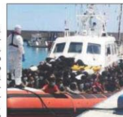
L'ultimo sbarco di migranti a Roccella

L'organizzazione sindacale nel suo comunicato diffuso alla stampa ritiene "improcrastinabile dare il via a delle scelte fin da troppo tempo rimandate in assenza delle quali si pongono in grave rischio la sicurezza e la salute degli operatori di Polizia ed a seguire quelle della cittadinanza intera. L'argomento sbarchi – prosegue la nota del Siulp – da molti decenni non riveste più carattere di eccezionalità ma di normalità. Si continua però a lavorare in emergenza come se si volesse elevarlo a criticità e difficoltà maggiori di quelle che già naturalmente gli appartengono. Condizioni di criticità determinate dalla totale indifferenza